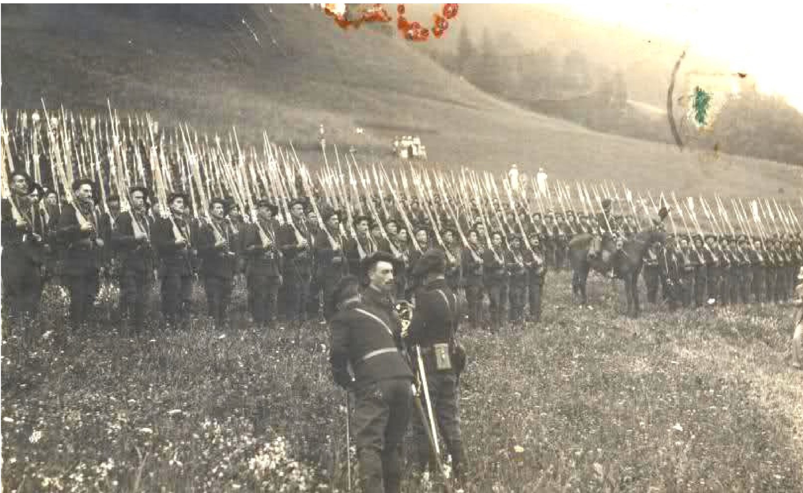
Le commandant, de PARIZOT de DURANT de la BOISSE est décoré devant son 22 e BCA fin juillet 1914. Il sera tué le 3 septembre suivant lors d'un assaut sur la Tête de Behouille en arrivant à la tranchée ennemie. Au soir de cette terrible journée, ils ne sont plus que 400 au 22 e BCA sur 1700 au départ d'Albertville !