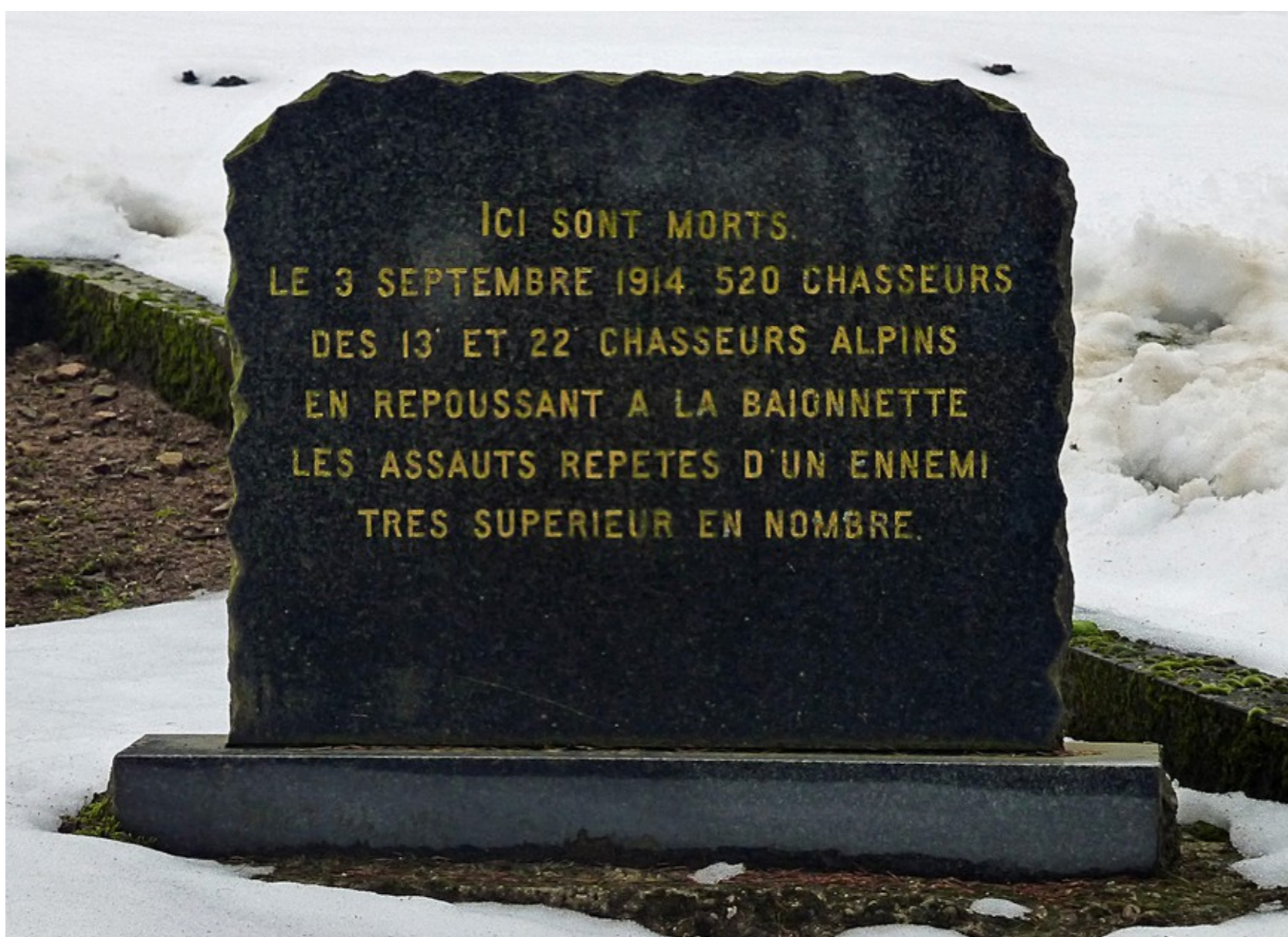
Stèle du carré mémorial de la Tête de La Behouille.