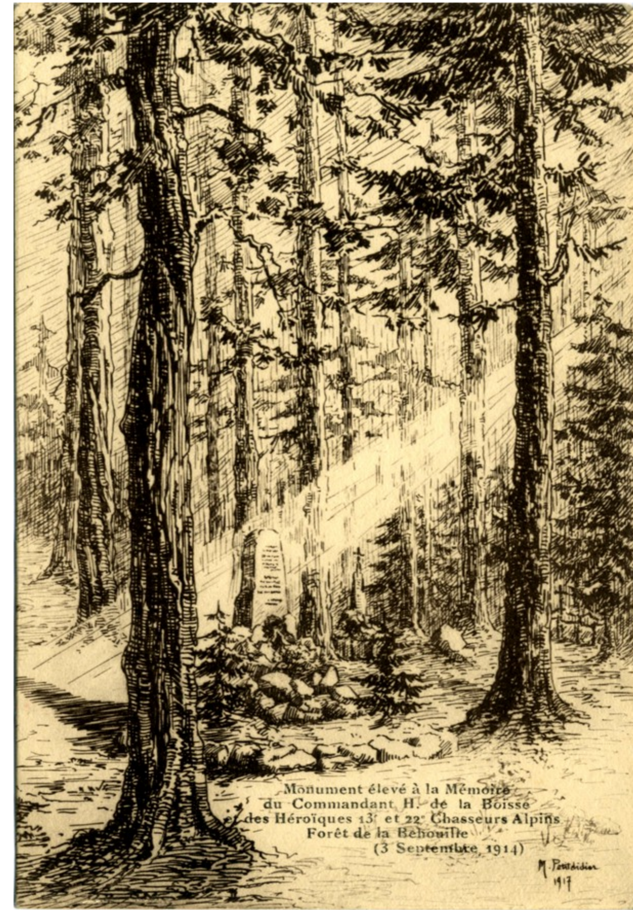
Monument à La Behouille à la mémoire du Commandant H. de la BOISSE du 22 e BCA tué le 3 septembre. Carte postale par Marie Petitdidier

Les troupes même, qui défendaient Fraize, se sont repliées sur les hauteurs de Clefcy. Situation critique, sinon désespérée !