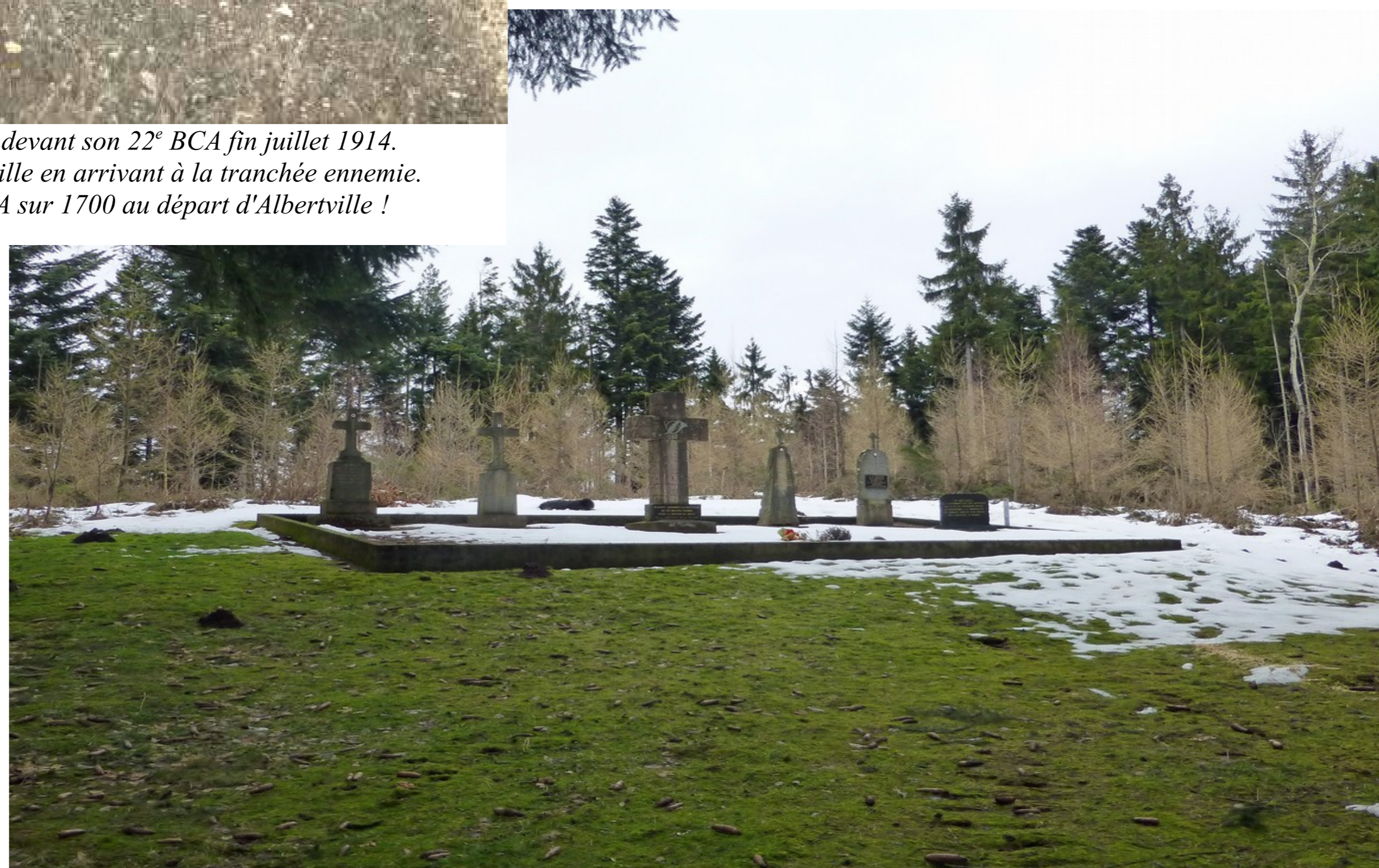
Le carré mémorial de la Tête de La Behouille de nos jours