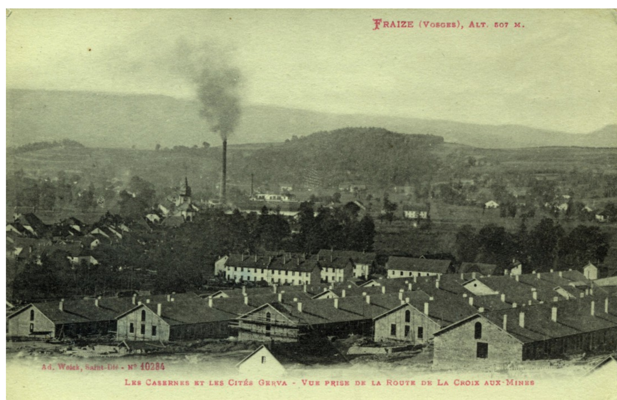
Vue des casernes en fin de construction sans le bâtiment du mess ni le pavillon de l'Hôpital