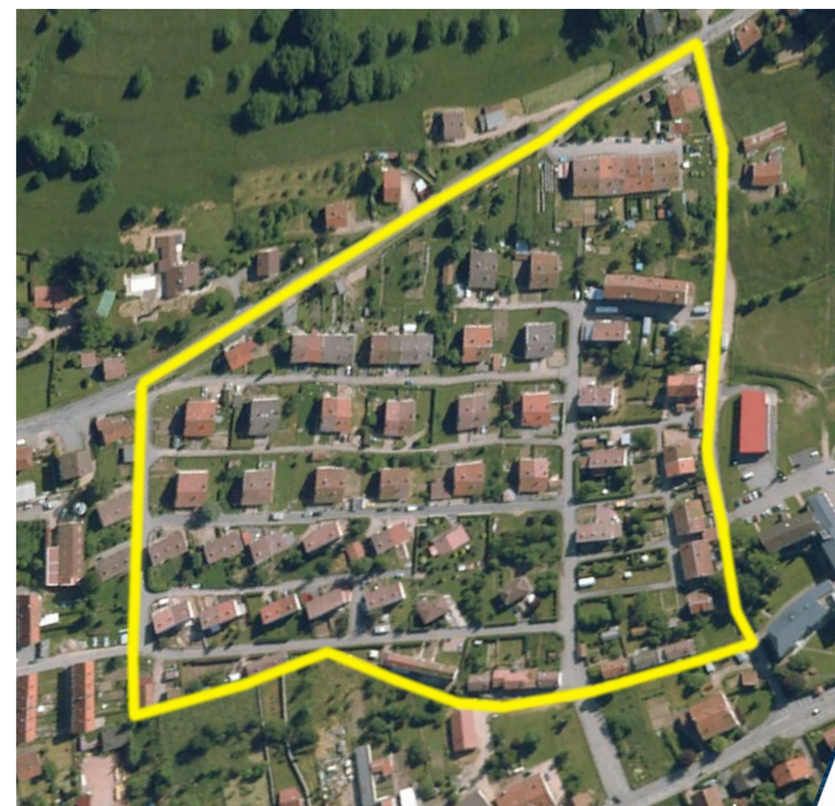
Vue par satellite du Quartier Neuf aujourd'hui

Il est facilement accessible grâce à ses accès ouverts depuis le CD 23 en haut, la rue de Gerva à gauche, et bien sûr son accès principal par la rue (re)baptisée Rue du 158 e RI 10 débouchant dans la rue de La Costelle et se prolongeant vers le haut jusqu'au Mess. Il est desservi à gauche verticalement par la rue du Quartier Neuf, et de haut en bas par les rues des