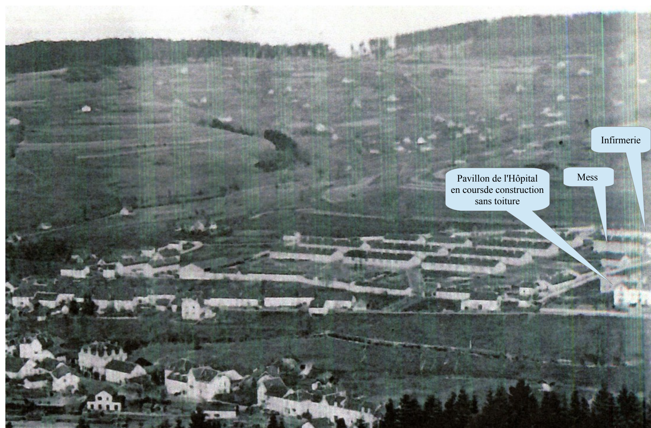
La caserne est terminée. Noter le pavillon de l'hôpital construit mais non couvert.

Nota : On n'a pas trouvé d'information précise sur la date de règlement définitive, non plus que sur les âpres négociations qui ont dû intervenir à propos du prix des parcelles (prix décidés avant guerre) compte tenu de l'inflation et de la forte dévaluation du franc dues à la guerre.