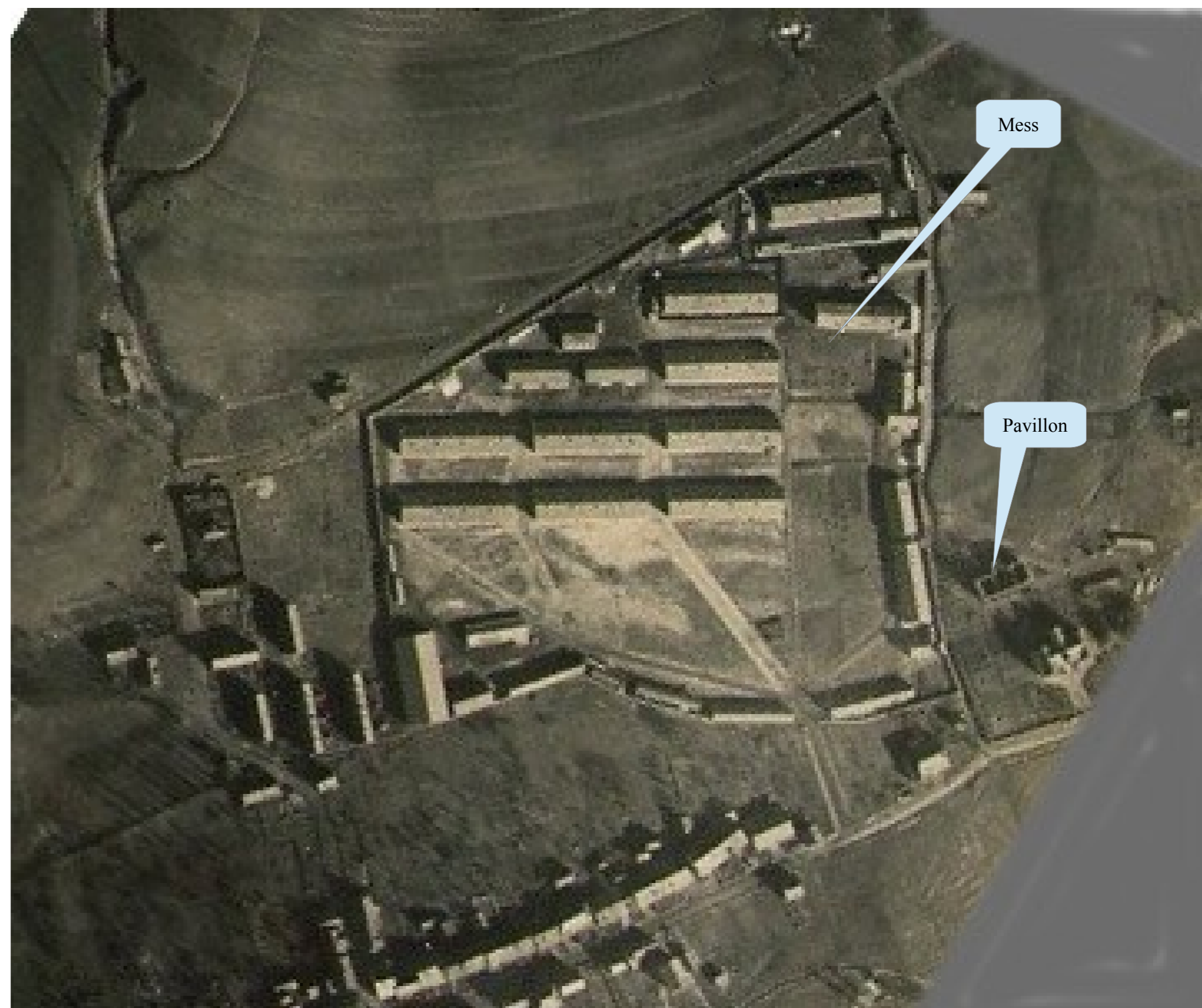
Vue aérienne prise par l'aviation allemande en 1918 sur laquelle on observe que tous les bâtiments prévus ont bien été construits avec en plus le Mess et le pavillon de l'Hôpital.

Les bâtiments le long du CD 23 dont les Cuisines ont disparu, de même que les bâtiments CI, BB à gauche, ainsi que F et E (manège et écuries).