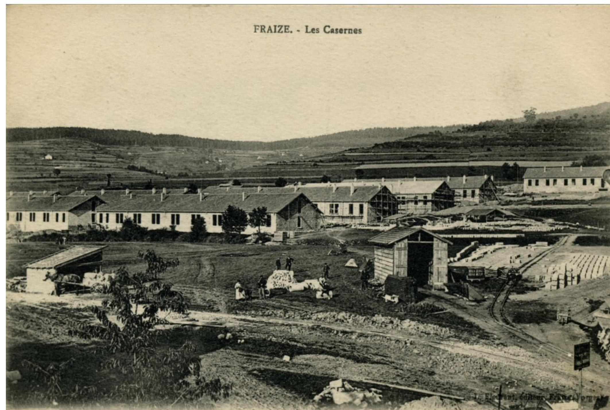
Construction de la caserne Coëhorn, à Gerva. À noter au premier plan la gare (!) du petit train à voie étroite chargé du transport des matériaux.

Sous la maîtrise d'œuvre du Génie d'Épinal, les travaux sont rapidement menés à terme, et presque tous les bâtiments prévus par le plan 6 ont été réalisés : huit bâtiments dortoirs identiques de 65 m sur 14, un bâtiment infirmerie, de même longueur mais plus large, alignés dans le haut du terrain, et dix-huit autres bâtiments annexes, disposés tout autour de l'enceinte complétaient le casernement (manège, forge, écurie, chaufferie, pavillon disciplinaire, poste de police, habitations, bureaux pour l'encadrement...). Tous les bâtiments sont en rez de chaussée sauf l'habitation pour les officiers qui a deux étages. Un bon tiers inférieur du terrain forme une esplanade pour les exercices des troupes. Le tout est